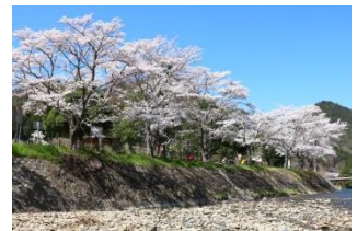
▲津保川沿いの桜並木