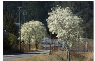
▲県道 63 号のこぶし