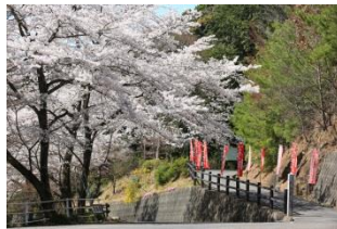
▲高澤観音第一駐車場の桜