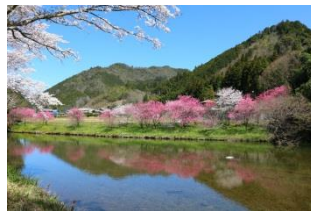
▲漁業会館向かい側の桃

昨年は、武儀各地に咲く春の花々に心を奪われまして、夢中でカメラのシャッターを切ったことを覚えています。