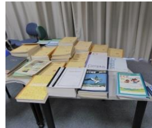
▲文房具やこども服、おも ちゃやベビーカーなどを 集めています

3 月 1 日から子ども用品リサイクル活動 『むぎっこ eco プロジェクト』がスタート しました。たくさんの方のご協力で、ノ ートや鉛筆等の文房具、制服、子ども服、絵 の具セットなどを提供していただきあり がとうございました。まだまだ募集中です ので、ご家庭で使わなくなった子ども用品 等がありましたらご提供ください。