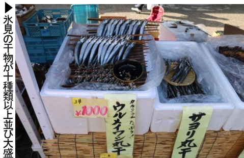
▶氷見の干物が十種類以上並び大盛況

用意した一八〇パックが午前中のうちに完売しました。 焼きしいたけの試食サービスには、大勢のお客様が列をつくり、「こんなにウマイしいたけは初めて」「匂いにつられて五パックも買ってしまいました」など、歓喜の声に沸いていました。(江坂)