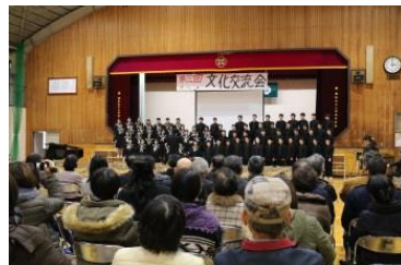
▲3年生にとっては最後の全員合唱

全員合唱では、感動のあまり涙を流していた来場者も。「津保川中学校の生徒はすごい!」、生徒たちの今後が楽しみです。(江坂)