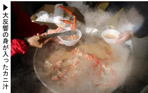
▶大反響の身が入ったカニ汁