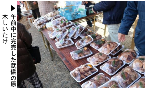
▶午前中に完売した武儀の原木しいたけ