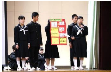
▲夢活や職場体験の活動発表

2月8日（金）、津保川中学校で第3回文化交流会が開かれました。発表の部では、生徒たちが取り組んできた夢活や職場体験など、スライドや手作りの発表資料を使って、わかりやすく解説されていました。