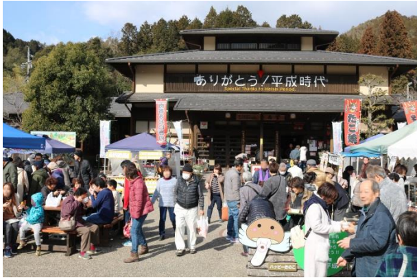
▲春まつりで大賑わいの道の駅平成

この時期は、あまり出んのやが、この日のために調整したんやー。武儀地域の特産品「原木しいたけ」を、地元農家さん五軒が出品。