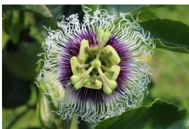
▲パッションフルーツの花