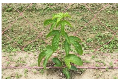
▲パッションフルーツの苗 (5月中旬)

このまま順調に育ってきますと、6月下旬ごろから花が咲きはじめます。花が咲けば咲くほど果実がみのりますので、「あっちにパッ！こっちにパッ！」っと大量の花を咲かせるように頑張ります！