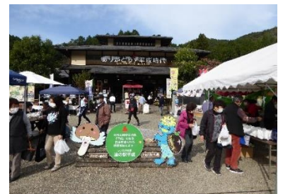
会社合併イベント