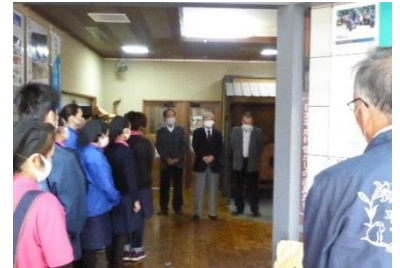
会社合併社長訓示