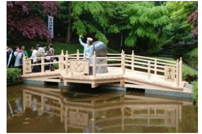
元号しあわせの架け橋渡り初め

道の駅「平成」は武儀地域の顔であり、大切な観光施設の一つとして、地域に愛され親しまれ、令和時代も持続可能な道の駅にしていこうと思っています。