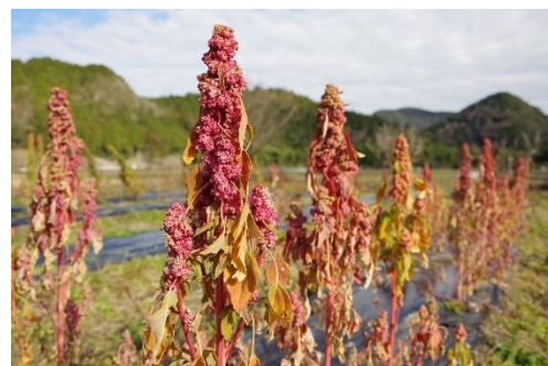
▲収穫前のキヌアの様子

令和3年1月から武儀の生活が始まり、今思うとあっという間だった様な感じもしますが、その時間の中で多くの初めての経験をしたり、町の人たちとの繋がりの中で助け合いの心や昔からの知恵など教わることができました。