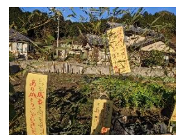
▲現在はメッセージの短冊が並ぶひまわり畑