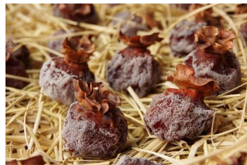
▲表面が白くなった干し柿

また、9月に種を蒔いたキヌアもしっかりと実を付け、先日2度目の収穫を終えることができました。これからこのキヌアも少しずつ乾燥を進めていこうと思います。