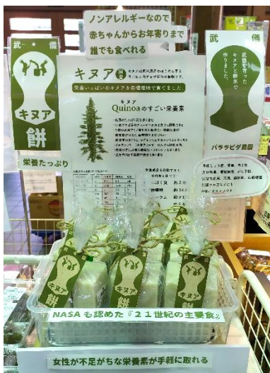
▲道の駅平成で販売中