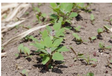
▲新しい方法で栽培中のキヌア