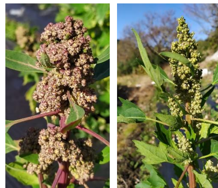
▲育ってきたキヌア

11月の産業祭に引き続き、12月も関市役所・岐阜市の長良公園に出店販売に行ってきました。関市役所での出店はキヌア・キヌア餅と以前からキヌアのコラボでお世話になっている西洞のカフェ「Shiranui」さんの食パンと、その食パンを使ったサンドウィッチを作り持っていきました。予想以上の方々にご来店して頂け、あっという間に完売になりました。市役所の出店は1月にも予定しているので、次回はさらに多くのお客様の手に渡るように用意していこうと思います。