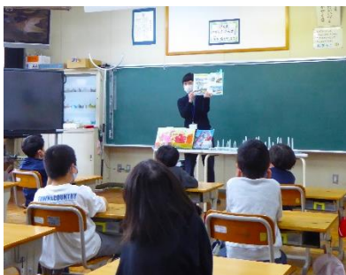
▲ブックトークの様子