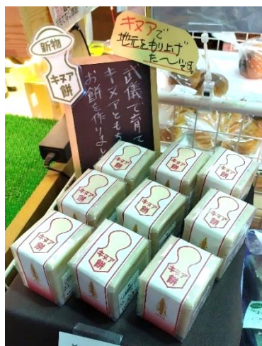
▲道の駅平成で販売中

中身は変わらず栄養満点の武儀産キヌアをたっぷり入れて作っていますので、お正月のお餅としても是非一度ご賞味下さい。