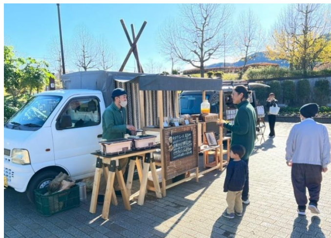
▲長良公園オーガニックマルシェ