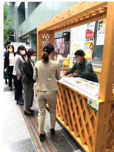
▲関市役所での出店販売

そして、以前からの出店の繋がりから紹介して頂いた長良公園オーガニックマルシェに初めて出店してきました。朝の散歩の方や家族連れの方々などがご来店して頂け、キヌアやオーガニック野菜の事、関市や武儀の話や新しいアイデアなど色々な方とお話することができ、とても良い時間を過ごす事が出来ました。このマルシェは毎月2回開催しているので今後も続けて出店していこうと思います。