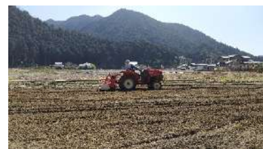
▲トラクターで耕起

後日一緒に種まきをしながら、栽培や今までの体験など色々と対話する事ができ、良い時間を過ごす事ができました。