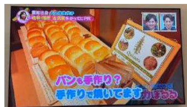
▲東海テレビの「タイチサン！」にて Shiranui 紹介 キヌア食パン・キヌアも初地上波