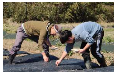
▲高校生のサポーターと種まき