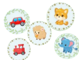
景品はかわいい缶バッジ！