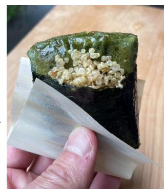
▲初採れよもぎキヌア餅