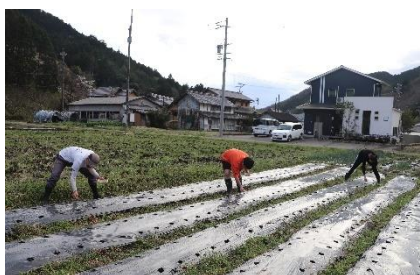
▲キヌアサポーターと種まき