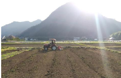
▲農家さんのトラクターでのサポート