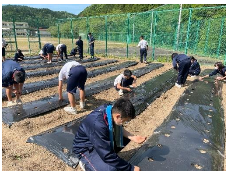
▲畝づくり、種まきをする津保川中学校3年生のみなさん