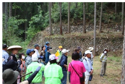
▲森勝五郎の屋敷跡を見る参加者