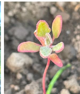
▲ふちの赤いキヌア

2023年が始まってから今月末で半年が過ぎようとしています。津保川では鮎が跳ね、夜は虫やカエルの鳴き声が聞こえてくる季節になってきました。