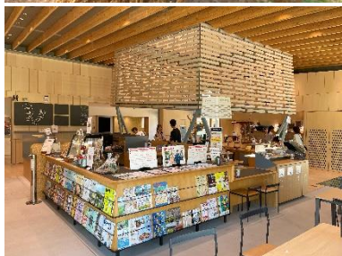
▲せきテラスのカフェ