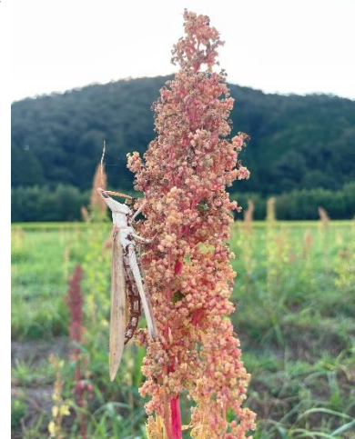
▲キヌアでくつろぐ ショウリョウバッタ

まだまだ暑い日が続きますが、体調管理や水分補給を忘れずに良き秋のはじまりをお過ごし下さい。