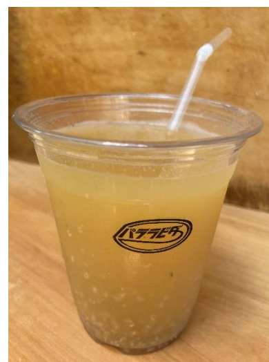
▲限定販売中のキヌアジュース