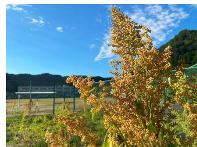
▲津保川中のキヌア