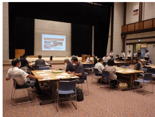
▲個別避難計画作成についての説明会

今回は、6自治会に対する説明会でしたが、今後は対象自治会を拡大していく考えです。まずは武儀の自治会で積極的に賛同していただき、関市全体のモデルケースとなる事を目指しております。