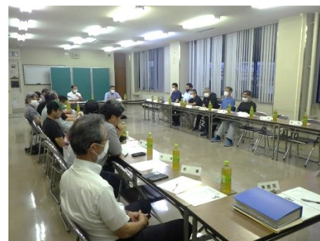
▲カローリングについて話し合う 武儀地区スポーツ部長会