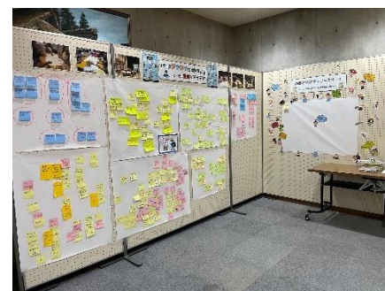
▲センター内に設置したスペース