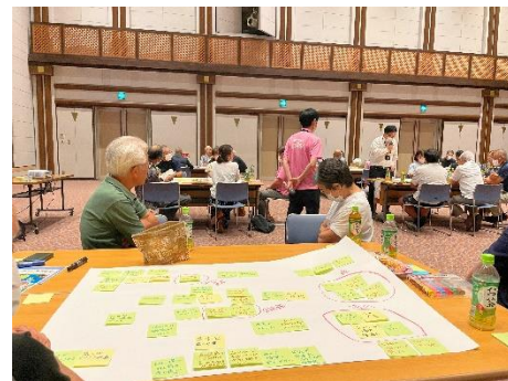
▲むぎがやがや会議