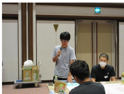
▲発表をする参加者