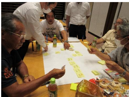
▲思いついたことを付箋に書いて貼り、似た内容をグループ化していく。