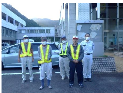
▲武儀環境美化グループのみなさん