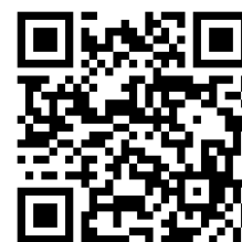
▲日本平成村ホームページ

おぎがやがや会議の様子や出された課題とアイデアは日本平成村のホームページでも紹介しています。通信で紹介しきれなかった意見も掲載していますので、ぜひご覧ください。