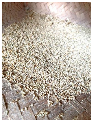
(上) 選別前のキヌア (下) 選別後のキヌア