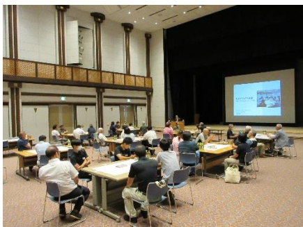
▲おぎがやがや会議会場

9月1日(金)19:00~20:30 に武儀生涯学習センター内多目的ホールにて、「おぎがやがや会議」を開催しました。武儀地域在住・在勤の方々が37名参加し、武儀地域が抱える課題やアイデアを話し合いました。