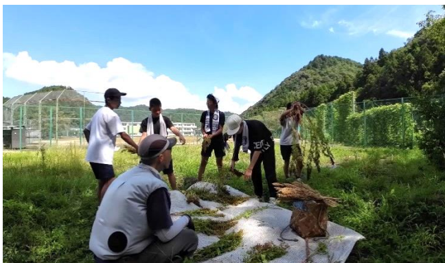
▲夏休み、津保川中学校での収穫