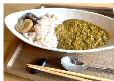
▲キヌアを使ったカレー