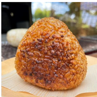
▲キヌア入り焼きおにぎり

武儀地域協力隊として活動中。 現在武儀の新しい特産品として キヌアの栽培に挑戦中!