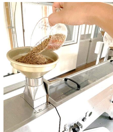
▲キヌア選別の機械

今年も残すところあと2ヶ月です。秋の紅葉や食材も楽しみながら、いつもバタバタしてしまう師走に向け少しずつ準備を進めていこうと思います。皆さまにとっての良き11月をお過ごし下さい。