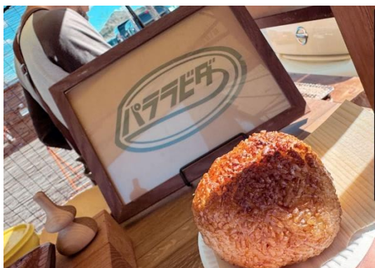
◀ 11月の出店で出したキヌア入り焼おにぎり

キヌアの授業をきっかけに春の畝作りから選別作業など一緒に汗を流して作り上げてきた事やその時間で今までの仕事の事や海外での事など色々な話をしていた事を、こんな風に思ってくれていたのだなどと改めて文章で知れ、限られた時間でしたが津保川中学校のみんなと一緒に過ごせたとても良い時間だったと改めて実感しました。