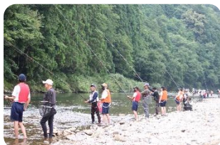
▲アユの友釣り体験