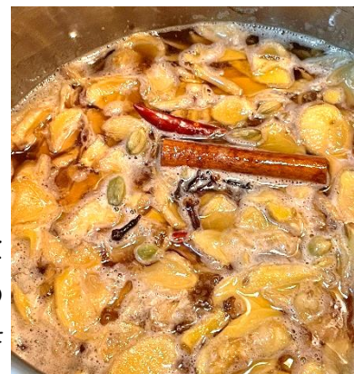
▲ジンジャーシロップ

発表会は上之保生涯学習センターの多目的ホールで12月2日午前9時から行われます。ご都合よろしい方は是非ともお越しください。これから更に冷え込みも厳しくなってくると思いますが、楽しい催しも増えてくると思いますので体調を整えて、皆様にとって良き師走の時間をお過ごしください。