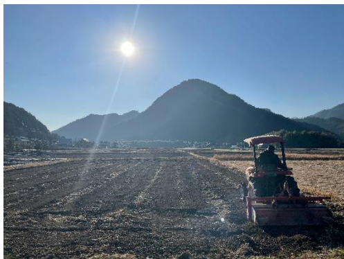
▲トラクターで耕起して頂きました。