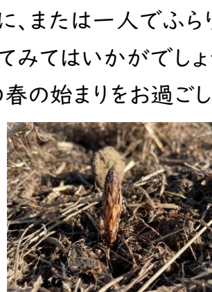
◀ 顔を出 したつくし