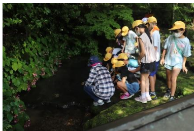
▲お宮の清水に触れる生徒