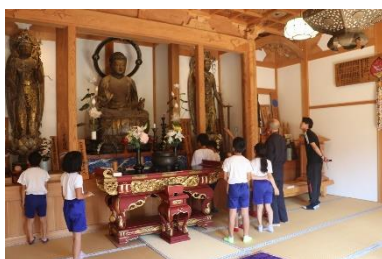
▲仏様をじっくりと見る生徒