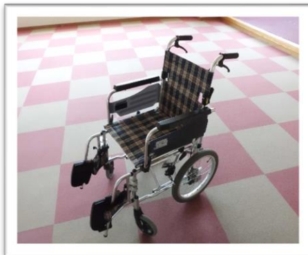
車椅子のイメージ