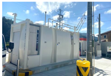
▲先進地事例。長野県売木村にあるコンテナ型地上タンクガソリンスタンド。