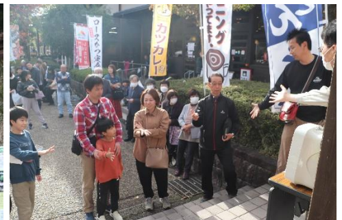
▲▼ビンゴ大会 景品受取の様子