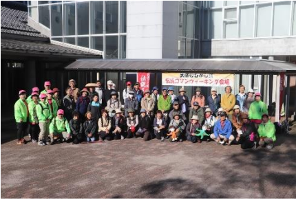
▲出発前の集合写真