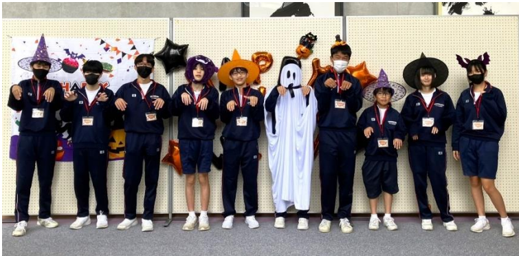
▲ボランティアに来てくれた津保川中学校の生徒たち