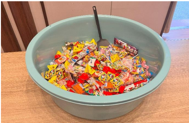
▲お菓子すくい みんな上手にすくっていました