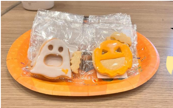
▲大人気だったアイシングクッキー(お菓子販売)