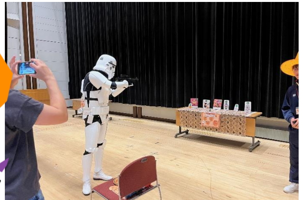
▲ストームトルーパーが遊びに来てくれました！