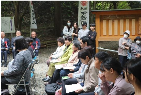
▲式典に出席した受賞者たち

11月10日(日)、道の駅平成裏手にある、しあわせの気の森で「第3回しあわせの架け橋短歌大会2024優秀作品発表大会」が開催されました。本大会では、2024年5月1日から8月1日の期間中に、一般の部171首、小中学生の部・855首の応募があり、厳正なる審査の結果、受賞作品が決定いたしました。