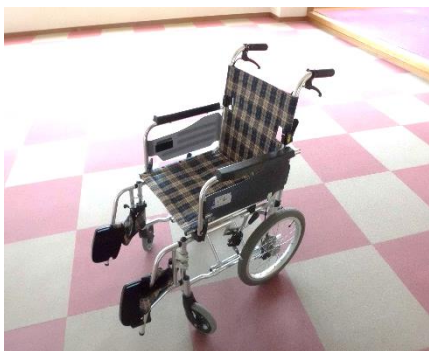
車椅子のイメージ

・①車椅子の貸し出し（無料）、②サロン用のゲーム類の貸し出し（無料）、③ボランティア活動保険の受付け、④食品寄付の受付け、⑤サロン用マイクセットの貸し出し（無料）。