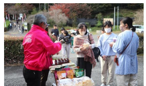
▲宝探しゲーム 番号札と景品を交換