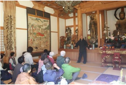
▲満願寺でのお話の様子