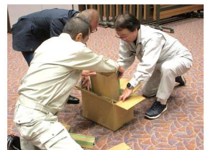
▲段ボールトイレ作り体験