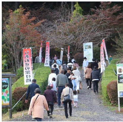
▲森に隠された番号札を探す参加者

▲日本平成村 公式ホームページ ( https://nihonhei-seimura.org/ )