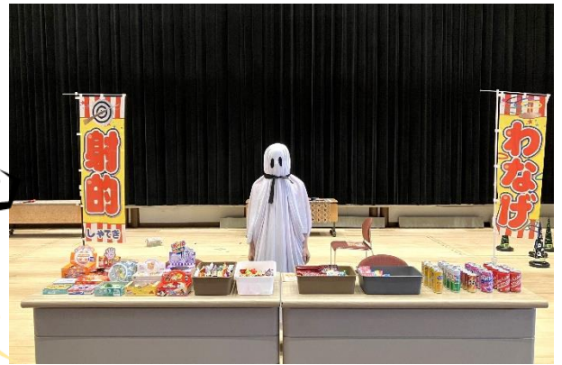
▲ゲームの獲得ポイントと駄菓子を交換