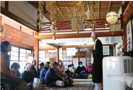
▲正栄寺でのお話の様子

11月9日(土)武儀生涯学習センターを発着点として、伝説ロマンウォークの会主催のウォーキング大会が行われました。51名の方が参加されました。今回は富之保大洞にある「満願寺」と中之保若栗にある「正栄寺」を巡りました。