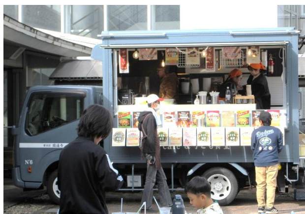
▲子ども食堂キッチンカー

子ども食堂のキッチンカーでは美味しいうどんやチョコスなどの食べ物、コーヒーやジンジャーエールなどの飲み物を販売。さらに射的コーナーもあり、多くのお客さんでにぎわいました。