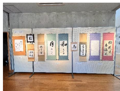
【写真】フォトクラブむぎ(写真)、紬の会(パッチワーク)、ささゆりの会(水彩画)、流泉会(書道)